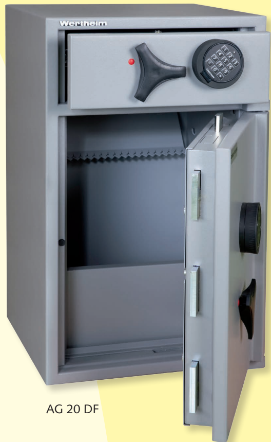
AG 20 DF