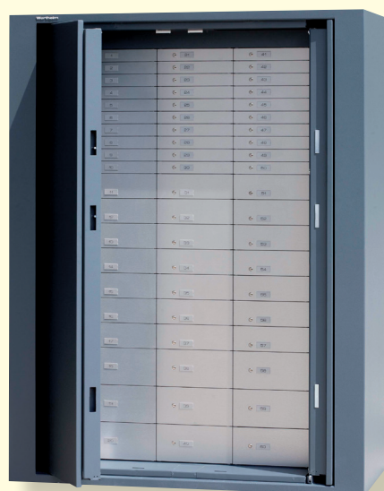
BWP 1902 avec compartiments bancaires