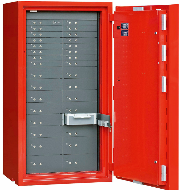
CWS 1600 AVEC COMPARTIMENTS BANCAIRES AVEC CHARNIÈRES EXTÉRIEURES